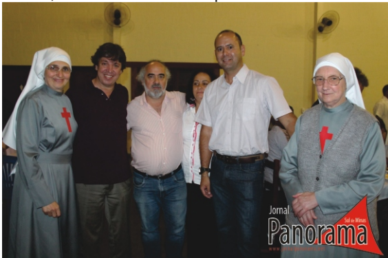
Equipe do Hospital, durante evento com a presença do secretário de Saúde de Minas.