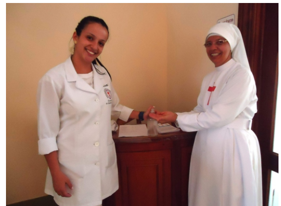
A campanha foi realizada com funcionários e visitantes do Hospital.